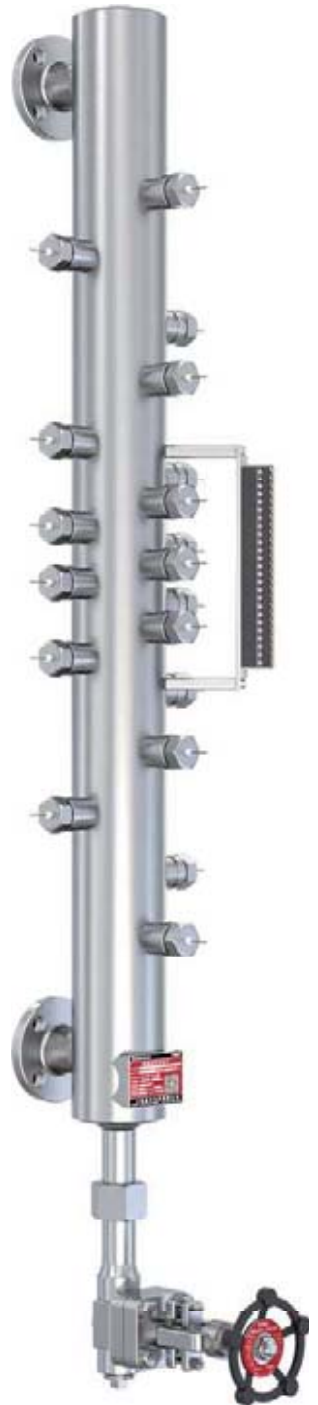
FD电接点水位计现场测量仪表结构图

我公司自主研发生产的FDZX型智能电接点水位计是一种交变脉冲型电接点式水位测量仪表。主要由取样筒、纯陶瓷电极以及二次显示仪表所组成。它具有良好的抗干扰性和稳定性，以其检测范围广、操作简单、智能控制扩展等诸多特点而优于同类产品。它广泛适用于锅炉汽包、高压加热器、除氧器、水箱、罐等水位的测量和控制；但不适宜在易燃易爆和腐蚀性较强的环境中使用。